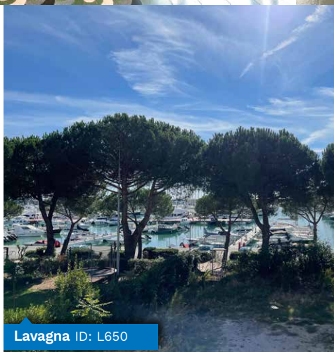
Lavagna ID: L650