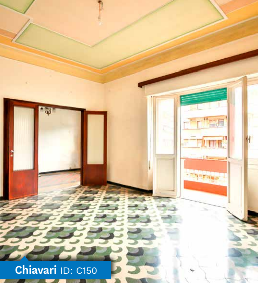
Chiavari ID: C150