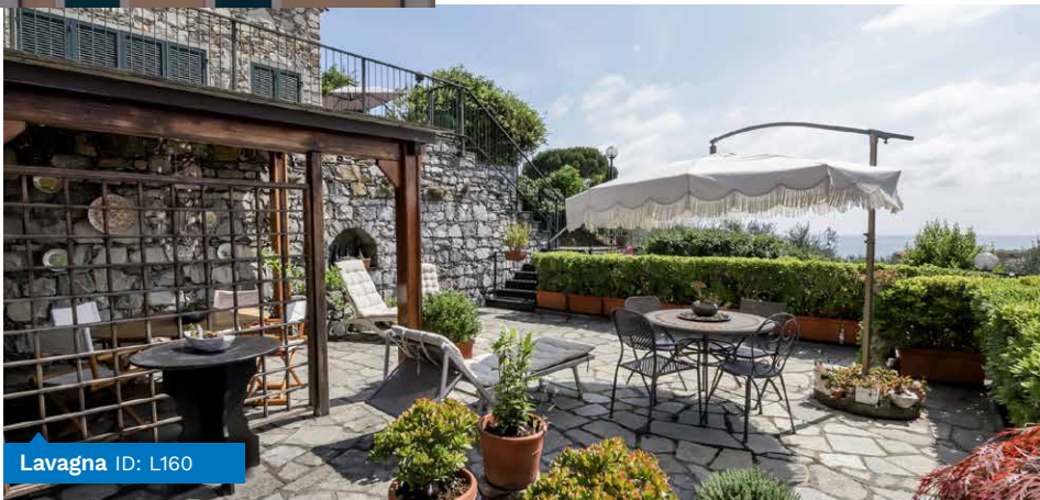
Lavagna ID: L160

NLC NUOVA LEVANTE CASA PROFESSIONISTI DAL 1996 STUDIO IMMOBILIARE VIA ROMA, 24 LAVAGNA