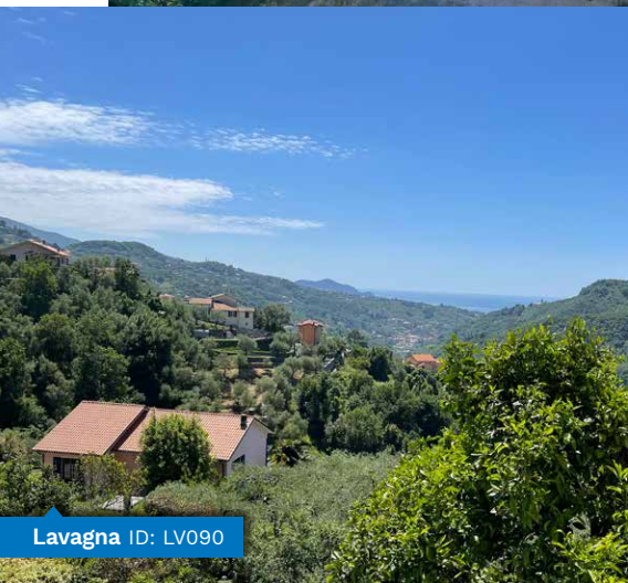
Lavagna ID: LV090