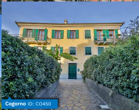
Cogorno ID: CO450