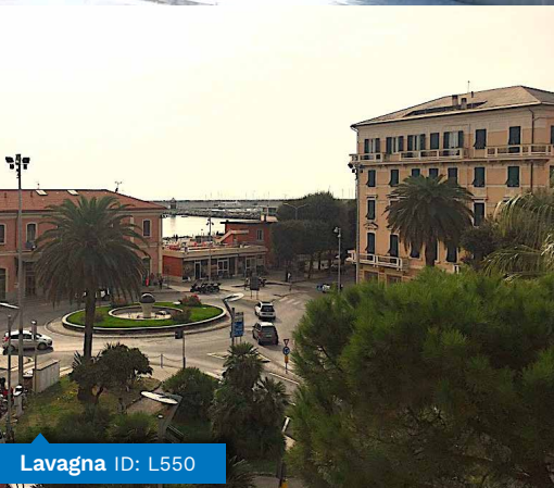
Lavagna ID: L550