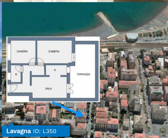
Lavagna ID: L350