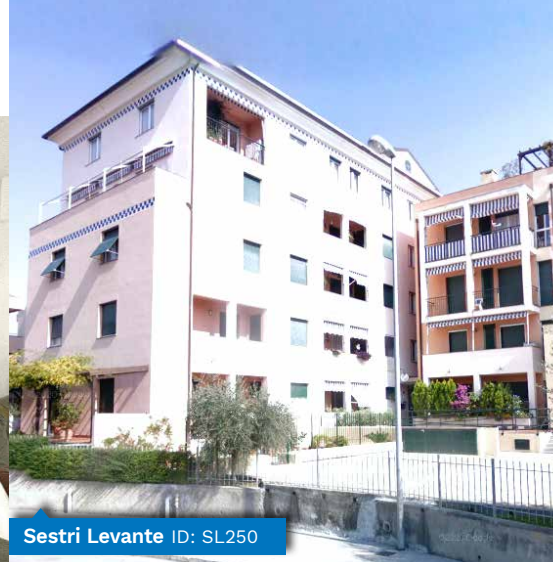
Sestri Levante ID: SL250